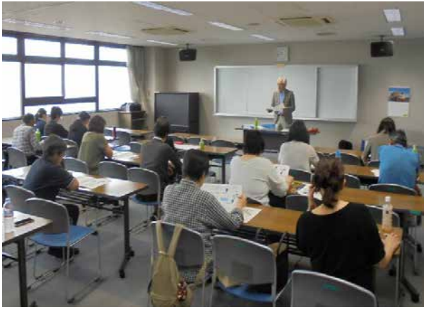
会場：座間市総合福祉センター

平成29年9月22日（金）、座間市総合福祉センターにおいて、地域の障害児・者のご家族の学習会が開催されました。SKサポートでは、この学習会に講師派遣を依頼され、当日は「ここが聞きたい!! 将来に向けた『お金』の話」と題して障害者ご本人のライフステージと親の年齢も関連づけて、財産形成、年金・医療、子への財産相続、成年後見制度、親亡き後のお子さんの生活支援など関心の高いテーマについてお話ししました。（社会貢献活動のため講師料等は無償です。）