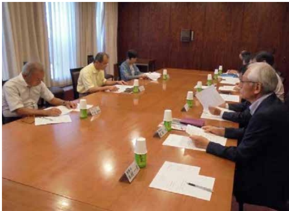
テーブル窓側が外部有識者の委員

平成29年8月29日（火）、本年度第2回業務管理委員会が開催されました。委員会の構成は、委員長（城南信用金庫）、副委員長（さわやか信用金庫）のほか、品川成年後見センター所長、弁護士、司法書士、社会福祉士などの有識者・専門家5人です。