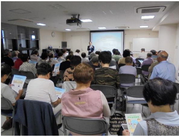
成年後見制度説明会は無料でお受けします

9月24日、SKサポートが地域貢献活動として力を入れて進めている成年後見制度説明会を大崎地区で開催しました。